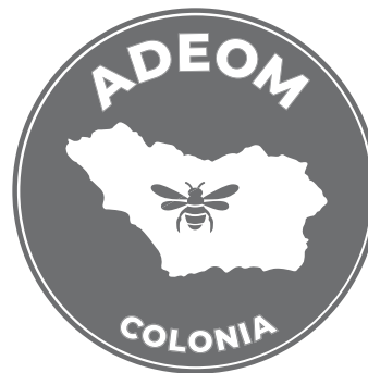
70% DE NEGRO