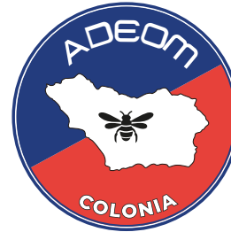
Cambio de tipografía

Todas estas normas son recomendaciones para la correcta visualización y funcionamiento de la marca y su sistema visual. Ante situaciones no previstas en este manual, se recomienda buscar la solución que mejor preserve la legibilidad y resguardo de la marca.