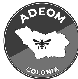
Uso en escala de grises