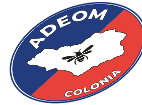
Deformar o girar