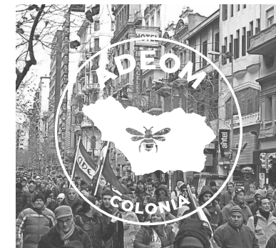
Falta de contraste y legibilidad