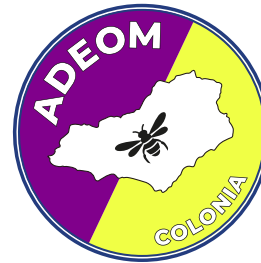
Cambio de colores