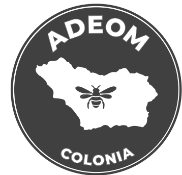
90% DE NEGRO